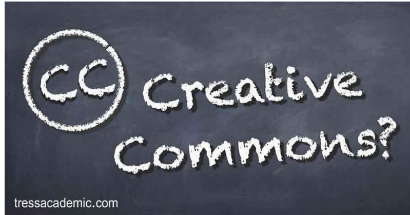
نواع حقوق الملكية:

من المتعارف عليه عموماً وجود ثلاثة أنواع لحقوق النشر وهي: