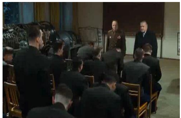
أول مجموعة مكونة من 20 رائد فضاء (من فيلم غاغارين)